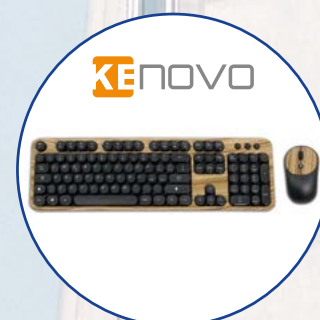
Tastiera e mouse wi-fi