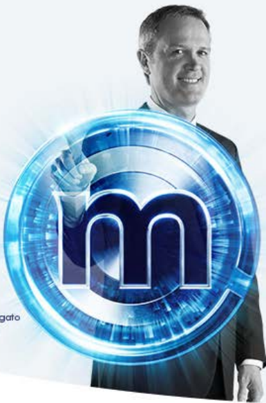
Massimo Doris Amministratore Delegato Banca Mediolanum

Messaggio pubblicitario. Prima della sottoscrizione delle polizze protezione sia di Mediolanum Assicurazioni S.p.A., tra cui Mediolanum Capitale Casa, sia di Mediolanum Vita S.p.A., distribuite da Banca Mediolanum, leggere il Set Informativo disponibile su banca.mediolanum.it , sui siti delle rispettive Compagnie e presso gli uffici del Family Banker.