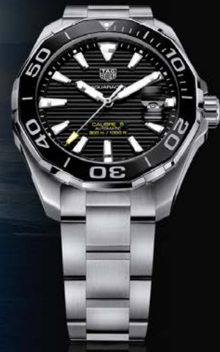
AQUARACER CALIBRE 5