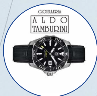
Orologio Tag Heuer Aquaracer